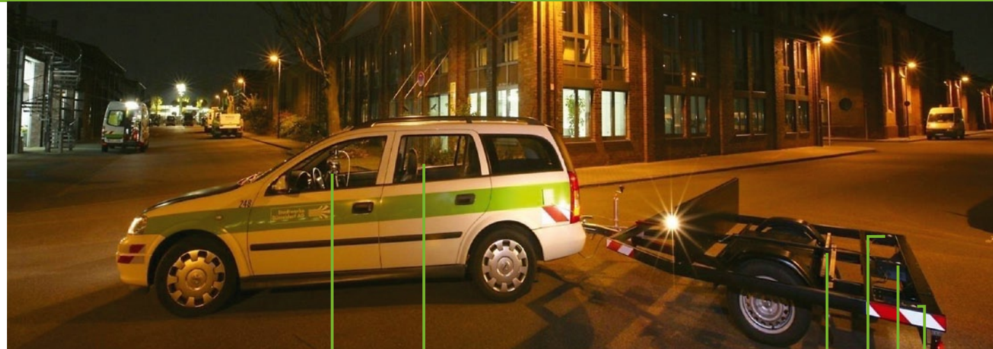
Leuchtdichte [cd/m 2 ]